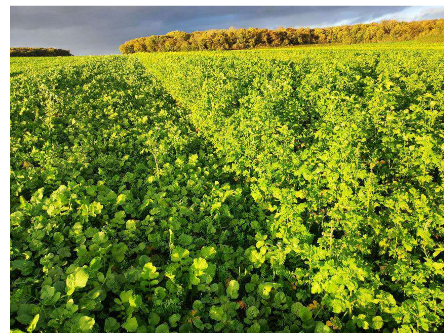
Essai Le Paraclet, 04 novembre 2022