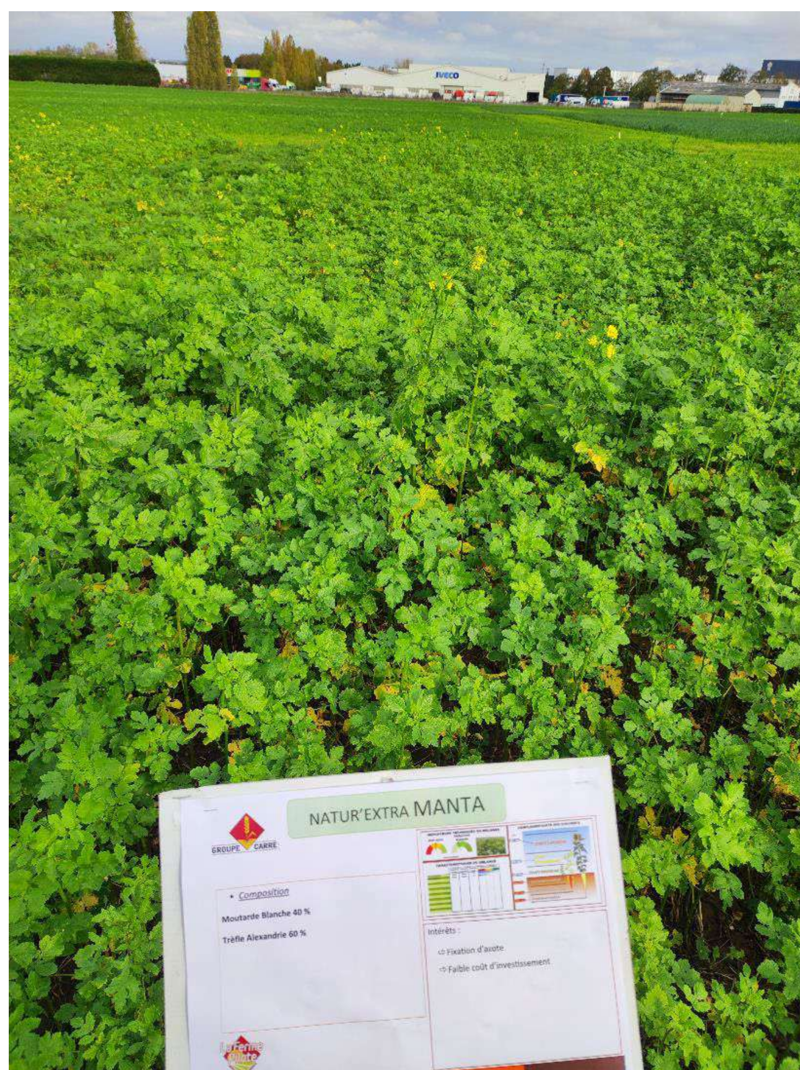
Essai Tilloy les Mofflaines, novembre 2023