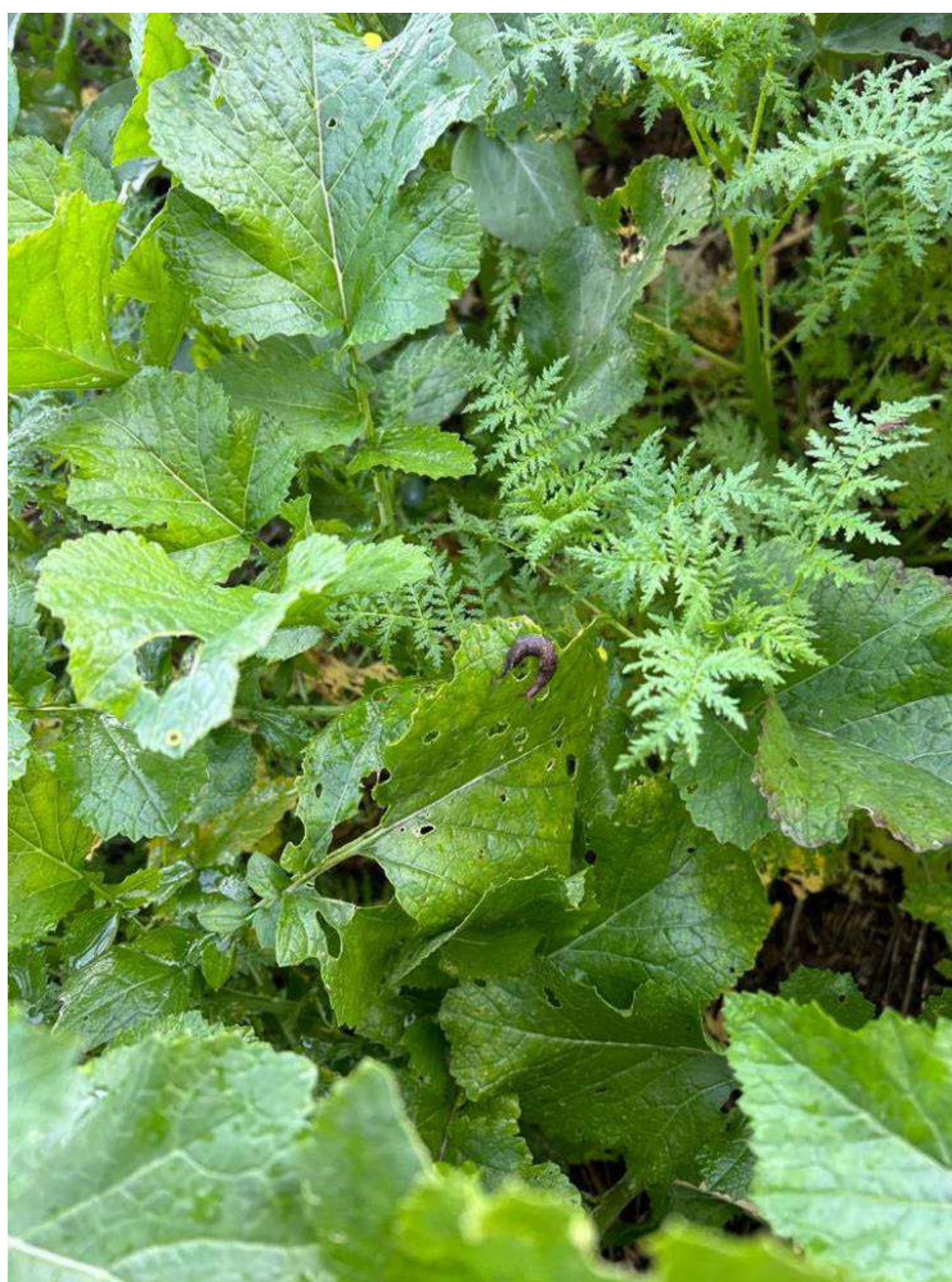
Essai semis à la volée avant moisson, octobre 2023