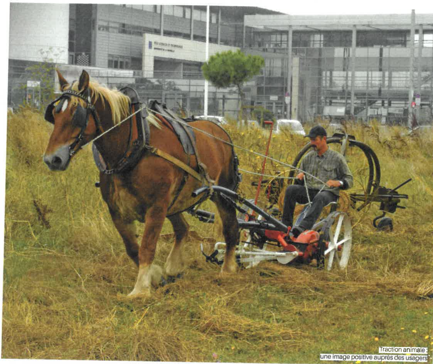
Traction animale : une image positive auprès des usagers