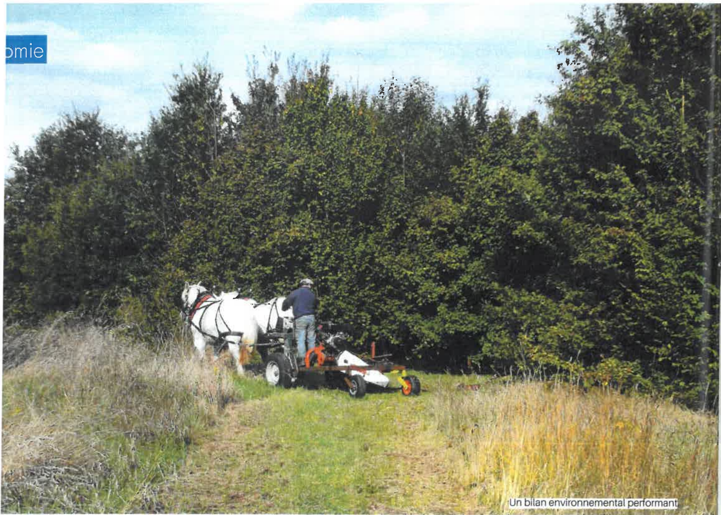
Un bilan environnemental performant